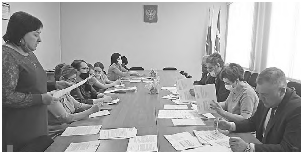
Заседание мандатной комиссии

Несколько поправок касаются организации сходов и собраний граждан. В частности, сход может созываться Думой городского округа по инициативе группы жителей соответствующей части территории населенного пункта численностью не менее 10 человек. В собрании граждан по вопросам внесения инициативных проектов и их рассмотрения вправе принимать участие жители соответствующей территории,